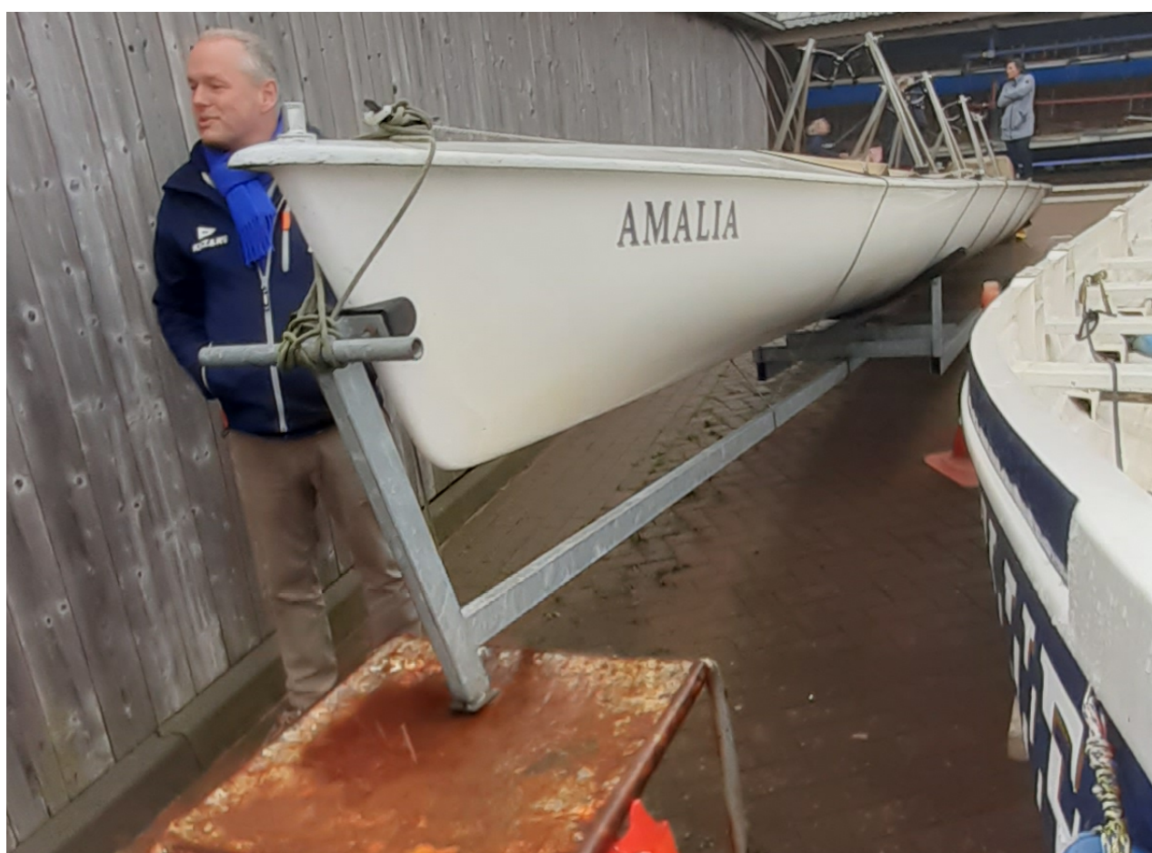
Nieuwe thuishaven Harderwijk?

den. Verder zou een verse laklaag 'Amalia' bijna in oude glorie kunnen herstellen. Kortom, er zijn wat extra handjes nodig voor een opknopbeurt, mochten we besluiten tot aanschaf over te gaan. Volledigheidshalve, voor de deskundigen onder ons, de boot is uitgerust met RVS opklapbare riggers en wordt geleverd met een gegalvaniseerde wal-trailer. Het aspirant bestuur, lees de kwartiermakers, buigt zich met René over de eventuele aanschaf en het transport naar Harderwijk, want de KNZ&RV ontbeert een geschikte weg-trailer. Indien positief dan zou het mooi zijn als 'Amalia' kan worden opgeslagen in een loods, zodat ze onderhanden kan worden genomen. Wederom, een dringende oproep aan aspirant-leden met technisch inzicht of gewoon handige knutselaars (m/v) om zich te melden voor het opknopteam zodat 'Amalia' hopelijk Harderwijk als thuishaven krijgt. Schroom niet en meld je aan via belia@rvharder.nl !