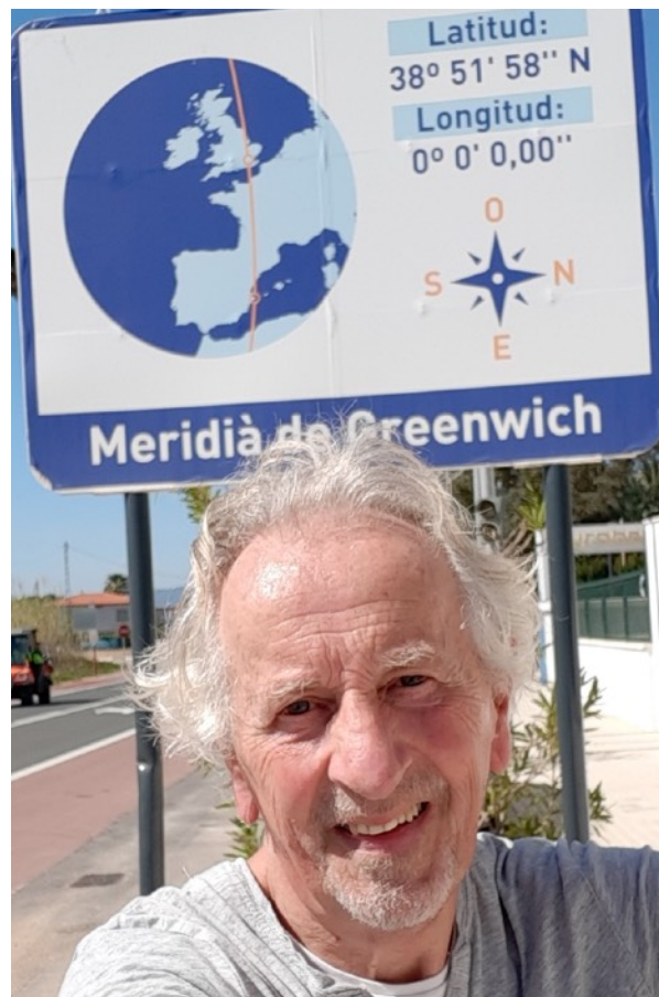
René roeit coastal in Spanje

Sinds 20 jaar verblijft René regelmatig in Spanje, in zijn huis in de omgeving van Denia aan de Middellandse Zee. Aanvankelijk trotseerde hij de zee in een zee-