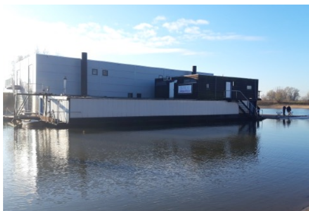
RV Isala met op de voorgrond de oude botenloods

twee kleedruimtes en een gecombineerd heren- en damestoilet. Helaas ontbreken er douches. De complete opbouw is door zelfwerkzaamheid van de leden van Isala in fases tot stand gekomen. Onderhoud en reparaties van de houten opbouw en technische installaties werden door de leden zelf uitgevoerd. Het stalen