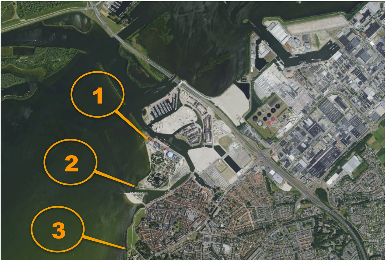
Water genoeg, nu nog een plekje aan de wal. Mogelijke locaties voor Coastal RV HARDER