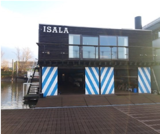
De totale breedte is 9 meter, zonder de trap links. Bij eventueel transport zou dat net moeten passen in de Roggebotsluis...

een aantal oudgedienden van Isala die bij de bouw betrokken zijn geweest. Het zou hen aan het hart gaan als de loods ontmanteld zou worden. Isala hoopt wel spoedig een gegadigde te vinden en overweegt desnoods verkoop tegen de oud-ijzerprijs, omdat de locatie in 2021 snel moet vrijkomen. Dat is ook de wens van de gemeente Zutphen.