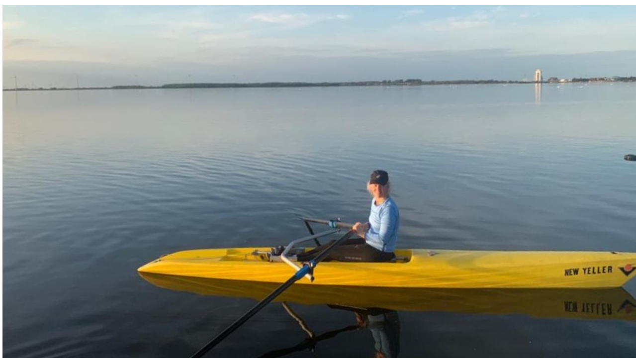
Geluidloze New Yeller op het Wolderwijd

twee verschillende ambitieniveaus: voor RV Harder als startende vereniging met 60 leden over een periode van drie jaar, en voor een volwassen RV Harder, die in vijftien jaar groeit naar een vereniging met 250 leden. In eerste instantie zou dat een vloot van minimaal zestien coastal roeiboten betekenen, en later, na vijftien jaar, een vereniging met een imposante vloot van ruim 40 boten. Tja, als je je vastbijt in al dit soort berekeningen dan is het inspirerend om ook te mijmeren over hoe ons 'cluppie' er dan over vijftien jaar bij zou moeten liggen: een mooi nautisch centrum, met een iconische uitstraling, waar diverse watersportvere-