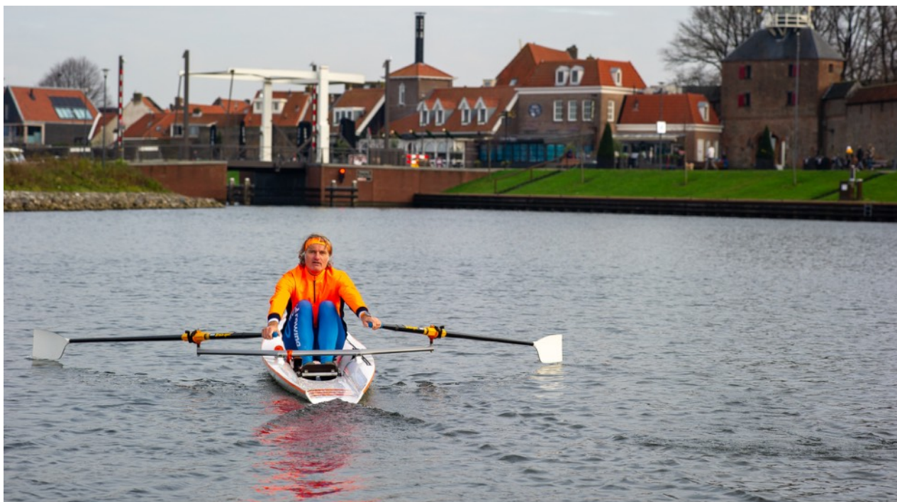
Harderwijk is ideaal voor coastal!

Absoluut! Ik heb contact gehad met de wethouder voor sport en die vindt het een fantastisch idee. We hebben verenigingen voor kanoën, zeilen, surfen, sloeproeien, de belangstelling voor het suppen neemt toe en er zijn diverse jachthavens. Coastal rowing is iets dat Harderwijk nog niet heeft en zou om die reden prima passen in het brede palet aan watersporten die de stad al te bieden heeft.