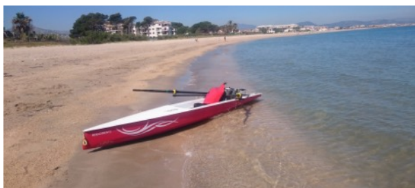
Coastal aan de Playa...

In 1988 kreeg René lucht van het plan om in Zeewolde een RV op te richten. Hij sloot zich aan bij dit initiatief. René: "Vijf bestuursleden en veertig enthousiastelin-